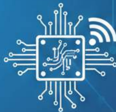
Istituto Tecnico Informatico e Telecomunicazioni