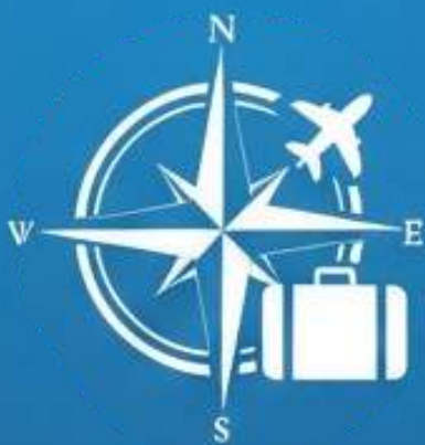
Istituto Tecnico per il Turismo